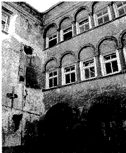
Sl. 1 in 2: Razvaline neke preteklosti (Grad Pohorski dvor) - Oddelek za psihiatrijo Splošne bolnišnice Maribor, leta 2000.